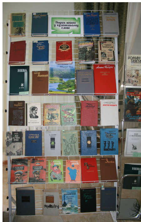
Виставки документів і книг з фондів Державного архіву Миколаївської області та Миколаївської обласної наукової бібліотеки імені Олексія Гмирьова, підготовлені до 100-річниці початку Першої світової війни.