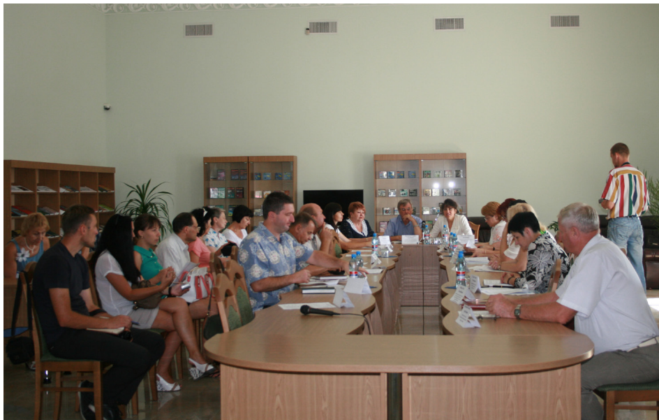
Засідання круглого столу, присвяченого 100-річчю початку Першої світової війни (читальня зала Миколаївської обласної наукової бібліотеки імені О. Гмирьова).