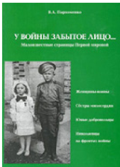
Обкладинка книги Владислава Пархоменка “У войны забытое лицо... Малоизвестные страницы Первой мировой”, підготовленої на підставі дослідження за документами Держархіву Миколаївської області.

Керівник обласного центру пошукових досліджень та редакційно-ви-